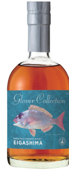
江井ヶ嶋 2019 3年