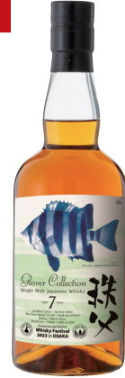
秩父 2016 7年