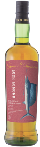
ロッホローモンド 2010 11年